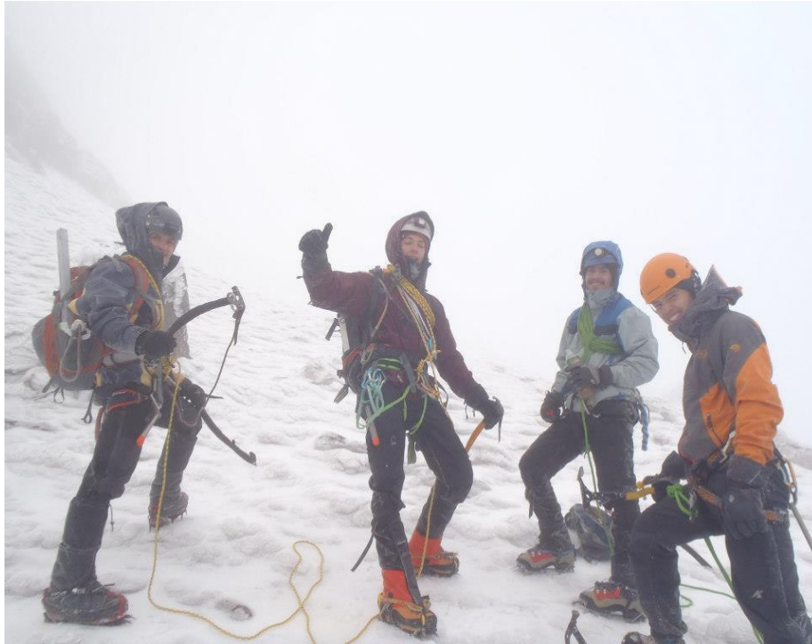
Ascendiendo al Iliniza sur con amigos y algunos compañeros del Club PUCE. Septiembre 2012.