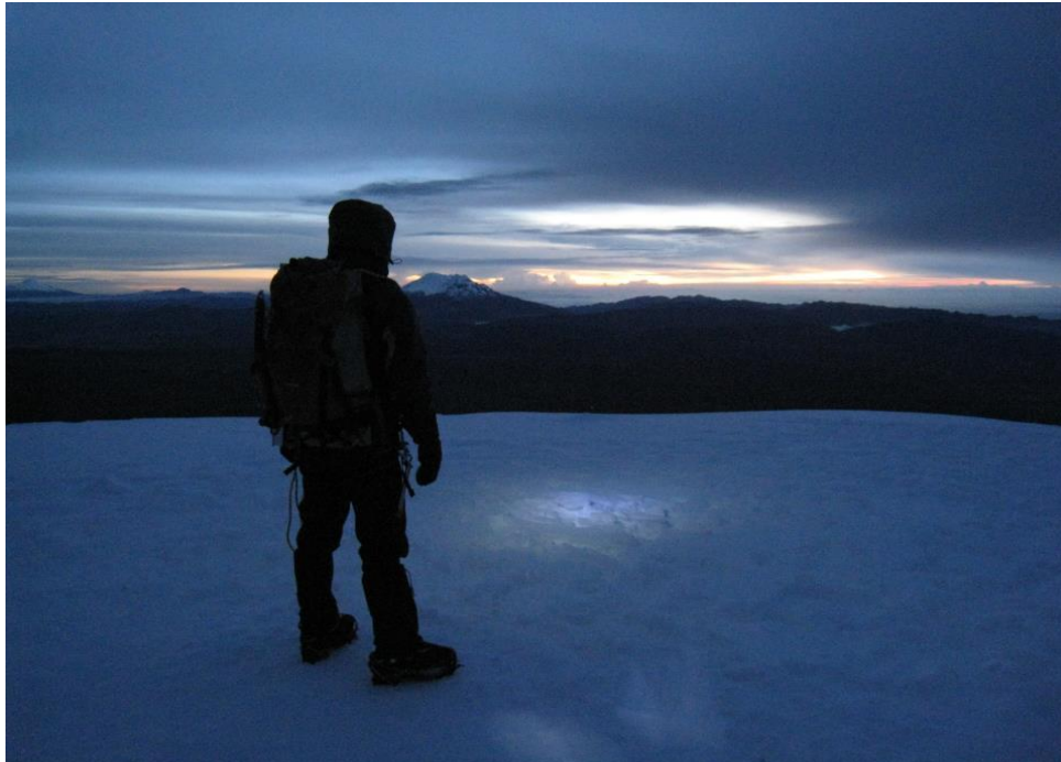
“¿Cuáles son los límites del horizonte?” En la cumbre del Nevado Cotopaxi, diciembre de 2011.